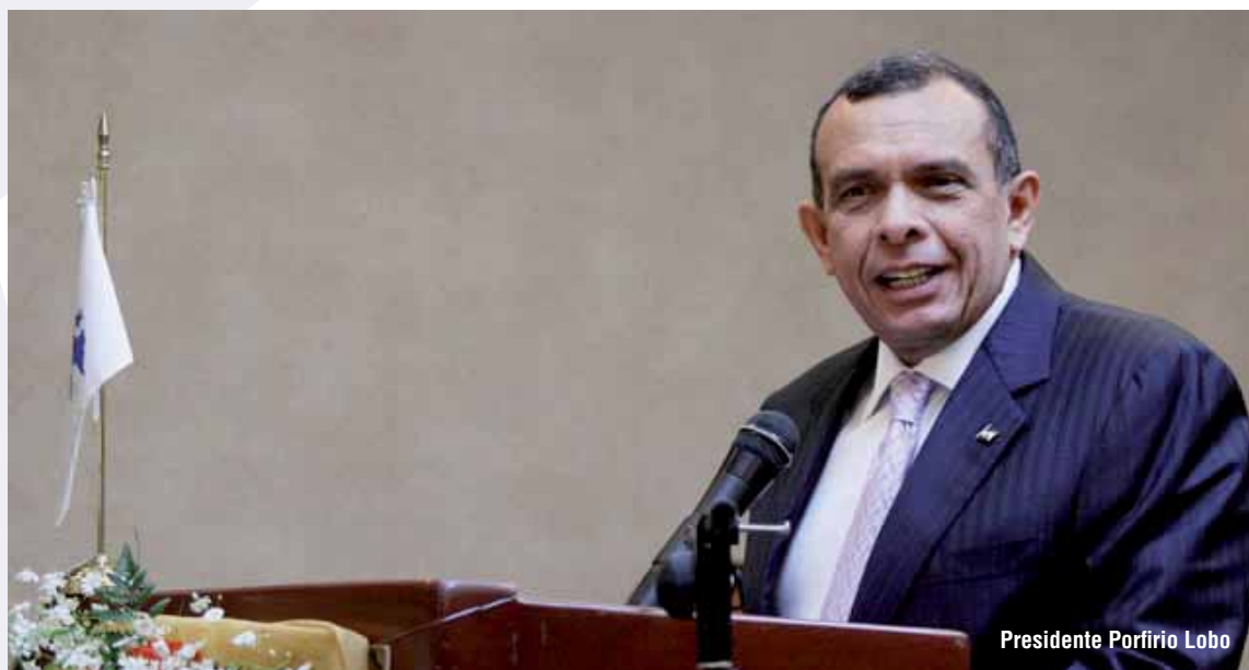
Presidente Porfirio Lobo

■ La ODCA y la Fundación Konrad Adenauer organizaron el Foro Honduras: Bases Político – Económicas del Proyecto Humanista con la participación del Presidente Porfirio Lobo.